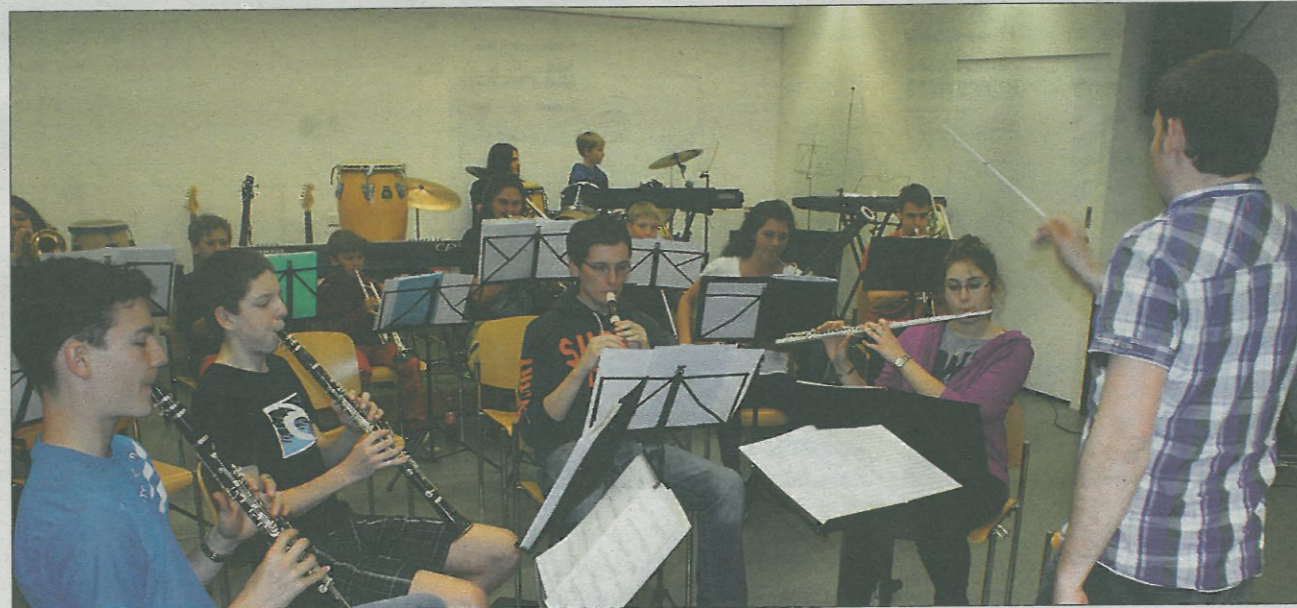
Impressionen der Allegro-Proben in Baden

Das Schweizer Jugendmusikfest findet nur alle fünf Jahre statt und zählt bei den Jungmusikern im Alter ab zwölf Jahren zu den bedeutendsten Anlässen. Neben einem vorgegebenen Aufgabenstück tragen die Jugendblasorchester am Wettbewerb auch ein Selbstwahlstück vor, wo die Schweizer Meister erkoren werden. In diesem Jahr nehmen in Zug 113 Formationen mit über 5000 Musikerinnen und Musikern teil. Für eine faire Bewertung sorgen gegen 50 Musik-Expertinnen und Experten, welche die vorgetragenen Musikstücke beurteilen und die entsprechenden Punktzahlen abgeben. «In unse-